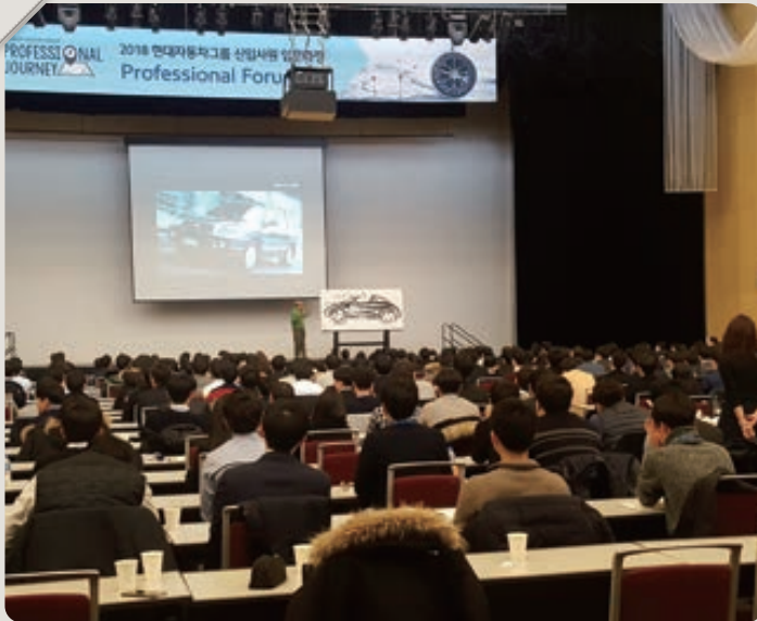
▲ 2018 현대자동차그룹 신입사원 입문과정 (2018年现代汽车集团新员工入门课程)