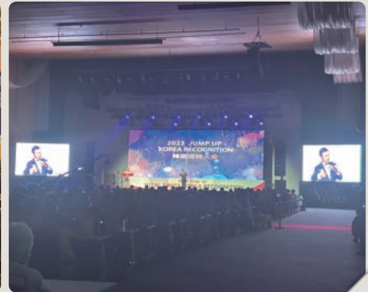
▲ 2023 Total Swiss Korea Recognition Jump up(企业颁奖典礼)