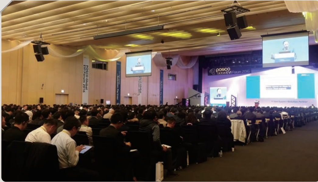
▲ 2016 포스코 글로벌 EVI포럼(2016年POSCO全球EVI论坛)