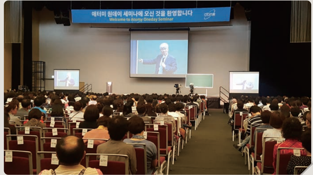
▲ 2017 에터미원데이세미나(2017年ATOMY一日研讨会)