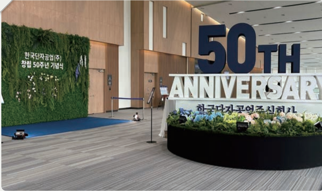
▲ 2023 한국단자공업 주식회사 창립 50주년 행사(2023年韩国端子工业株式会社创立50周年庆典)