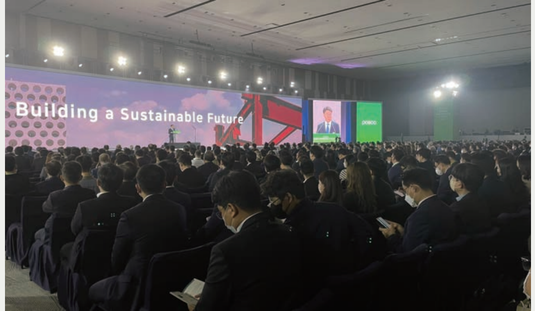
▲ 2022 포스코 친환경 소재 포럼(2022年POSCO环保材料论坛)