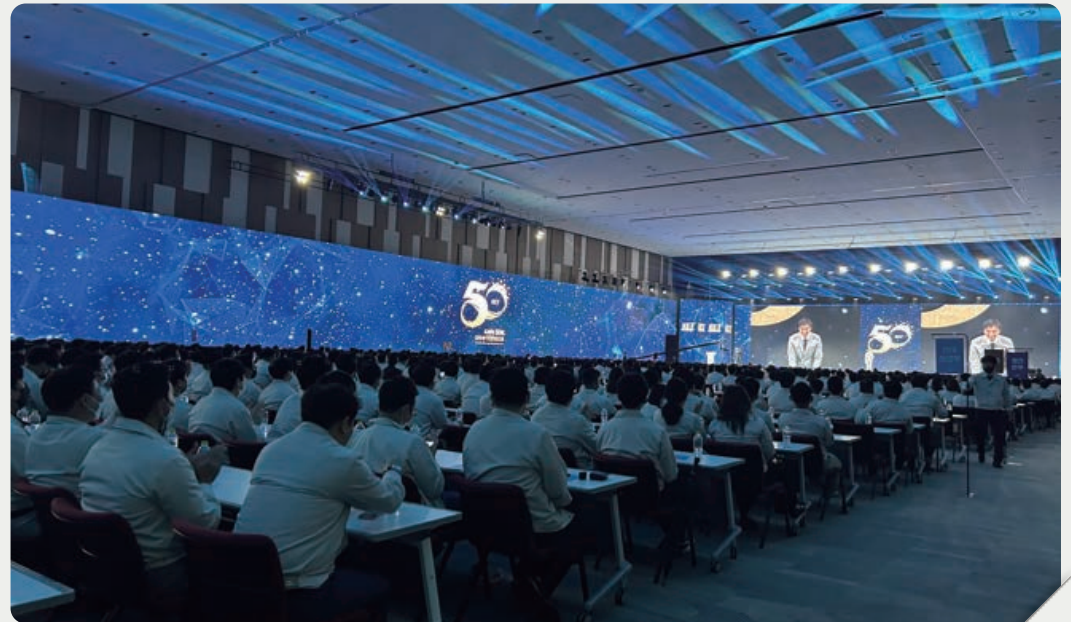
▲ 2023 한국단자공업주식회사 창립 50주년 행사(2023年韩国端子工业株式会社创立50周年庆典)