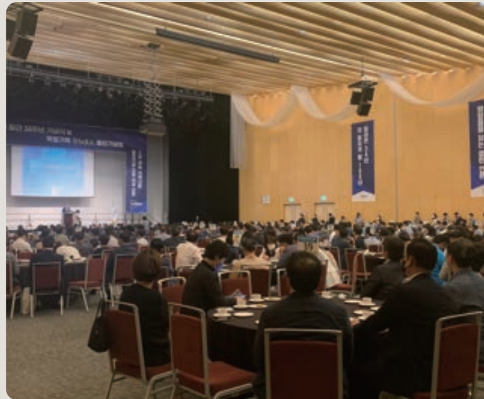
▲ 2022 인천일보 창간 34주년 기념식 및 출판기념회 (2022年仁川日报创刊34周年纪念典礼和出版纪念会)