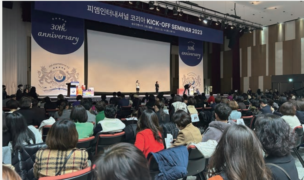
▲ 피엠인터내셔널 코리아 2023 Kick-off(PM国际韩国2023年启动)